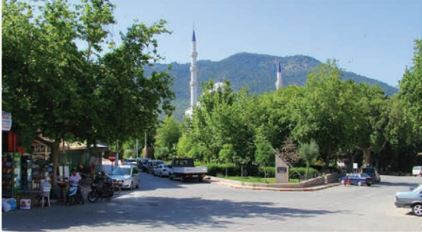
مركز مدينة ألتنيالا

الاسم القديم للمنطقة هو ديرميل التي أصبحت مدينة في عام 1955 تم اعادة تسميتها الى ألتنيالا عام 1990 يبلغ عدد سكانها الحالي 5422