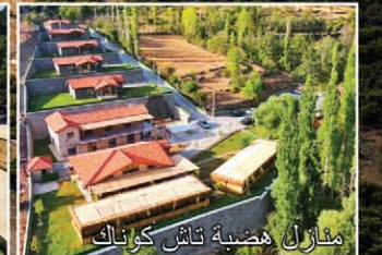
منازل هضبة تاش كوناك