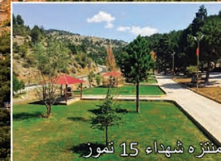
منتزه شهداء 15 تموز