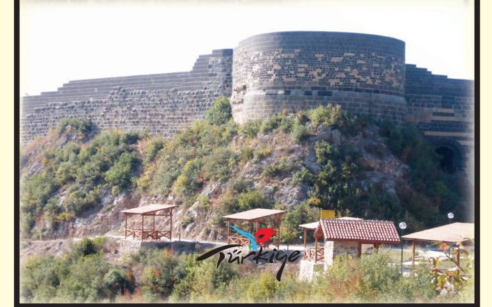
Harun Reşit Kalesi ve Düziçi Ovası